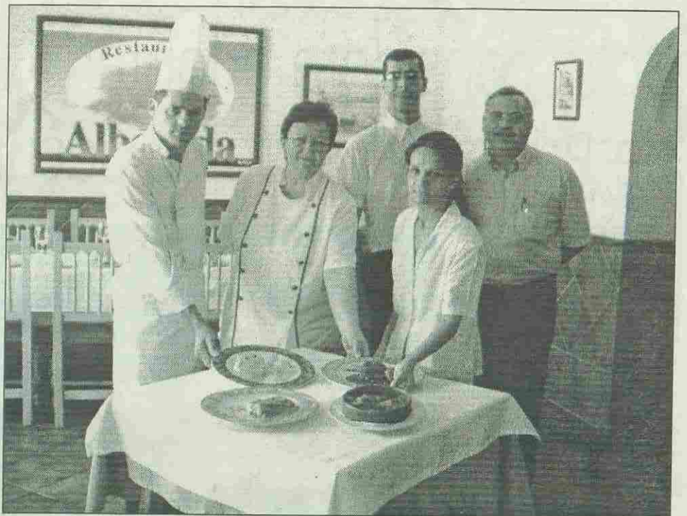
El personal del restaurante Alborada muestra algunos de los platos que se pueden degustar estos días. Más de una treintena de variedades esperan a los comensales que acuden a este local.

Este magnífico rincón gastronómico de Arroyo de la Miel ofrece una exquisita variedad de platos preparados con este pescado hasta el próximo día 26 de septiembre